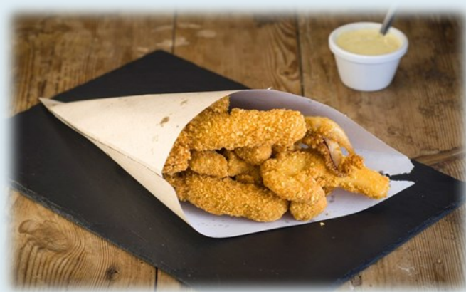
® Naym Casual Seafood

La carta se basa en pescado fresco procedente de sus propias cofradías, primando la calidad, y la innovación, ofrecido en preparaciones saludables y a precios asequibles, un concepto de comida rápida, que trata de fomentar el consumo de pescado y especialmente entre los jóvenes.