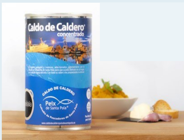
® Caldo de Caldero

para demostrar la versatilidad de este producto y otras especies de la zona, en la lonja organizan ocasionalmente muestras y cursos de cocina.